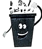
मानव निर्मित कूड़ा

स्वच्छता के इस महाअभियान में आपका सहयोग अपेक्षित है