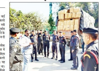
बाहरा पंचायत के बाहरा स्थित बाहरा में बाहरा पंचायत के प्रवर्तन दल ने बाहरा के कई स्थानों पर छापे मारकर 1830 किलो पॉलिथिन पकड़ी। पकड़ी गयी पॉलिथिन के साथ ही एक लवलाह में कूड़ा प्रबंधन केंद्र का निर्माण शुरू करने के लिए शक्ति वेस्ट मैनेजमेंट प्लांट में पैठ की गई।

नगर निगम के प्रवर्तन दल ने बाहरा के कई स्थानों पर छापे मारकर 1830 किलो पॉलिथिन पकड़ी। पकड़ी गयी पॉलिथिन के साथ ही एक लवलाह में कूड़ा प्रबंधन केंद्र का निर्माण शुरू करने के लिए शक्ति वेस्ट मैनेजमेंट प्लांट में पैठ की गई।