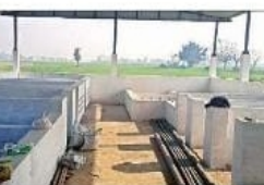
ग्राम डबल मैटेरिअल से रहा कूड़ा प्रबंधन केंद्र। अग्रम विचार

अग्रम विचार। शासन के निर्देश पर जेस कूड़ा एवं तरल अपशिष्ट प्रबंधन परियोजना के तहत विभिन्न ग्राम पंचायतों में कूड़ा प्रबंधन केंद्र का निर्माण कराया जा रहा है। इससे गांव को गंदगी मुक्त किया जा सके और कूड़े से खाद में तब्दील कर दिया जाए। यह स्थानीय व क्षेत्रीय किसानों के काम आए और रासायनिक खाद के प्रयोग से नष्ट हो रही भूमि को उर्वर और खास पाव जा सके। इसके लिए युद्ध स्तर पर कार्य किए जा रहे हैं। कई ग्राम पंचायतों में इसका संचालन शुरू हो