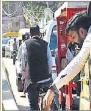
Campaign banning spitting in public kicked off on Thursday.

No more spit-and-run, offenders to get 'Piku' tag