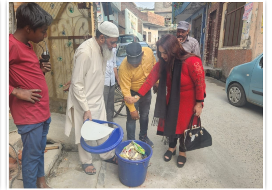
नगर निगम झांसी