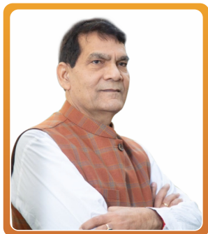
श्री ए० के० शर्मा माननीय नगर विकास मंत्री

लखनऊ। महामहिम राज्यपाल श्रीमती आनंदीबेन पटेल ने राज्य विधान मण्डल के एक साथ समवेत दोनों सदनों के समक्ष प्रस्तुत अपने अभिभाषण में नगर विकास विभाग द्वारा कराए जा रहे विकास कार्यों का उल्लेख करने के साथ ही स्वच्छता कार्यों में लीन सफाई मित्रों के प्रयासों की सराहना की। यह उत्तर प्रदेश के सभी निकायों में कार्यरत सफाई मित्रों के लिए गौरव का विषय है। सफाई मित्रों के प्रयासों से ही उत्तर प्रदेश के नगरीय क्षेत्र में गुणात्मक परिवर्तन संभव हो सका है। विपरीत मौसमी परिस्थितियों के सामने सफाई मित्रों के अडिग इरादों से ही धरातल पर स्वच्छता सुनिश्चित हो सकी है। इसके अलावा महामहिम राज्यपाल ने अपने अभिभाषण में शहरों को सुन्दर बनाने हेतु जनवरी, 2023 से 100 दिवसीय 'उत्तर प्रदेश व वैश्विक नगर' अभियान का जिक्र किया है। जिसके तहत नगरीय परिवेश को वैश्विक मापदंडों के अनुरूप बनाने का कार्य किया जा रहा है। तीर्थ नगरी प्रयाग में सफलतापूर्वक संपन्न माघ मेला विभाग के लिए एक बड़ी उपलब्धि है। इस ऐतिहासिक मेले में लगभग तीन करोड़ 30 लाख श्रद्धालुओं ने भाग लिया।