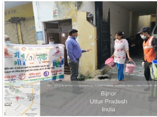
नगर पालिका परिषद बिजनौर