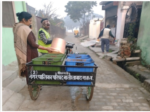
नगर पालिका परिषद खलीलाबाद