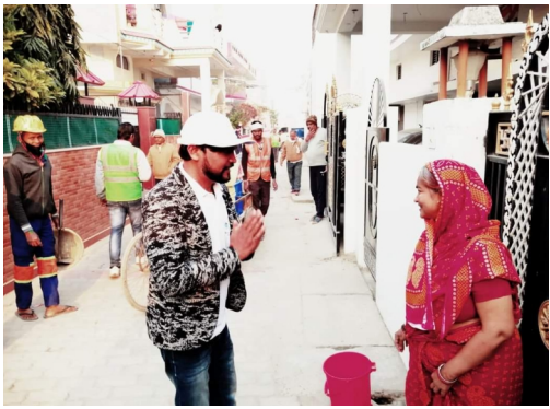
नगर पालिका परिषद मऊ