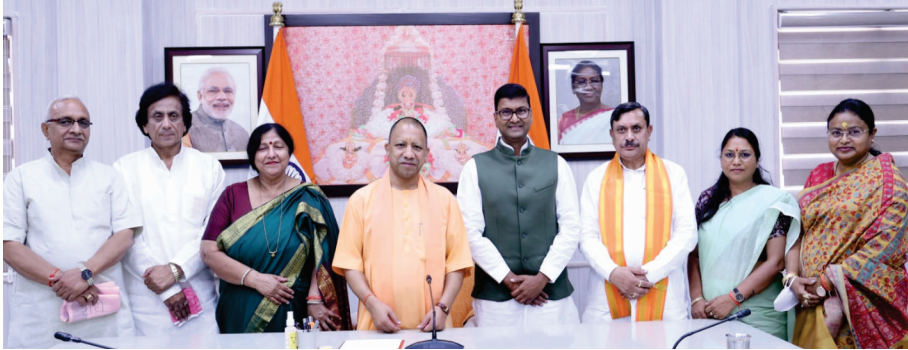
माननीय मुख्यमंत्री जी ने अपने सरकारी आवास पर नव निर्वाचित 7 महापौर से मुलाकात की

विकास एवं निर्माण कार्यों को गुणवत्ता एवं समयबद्धता के साथ पूरा कराएं। मेयर जनप्रतिनिधि के सहयोग और अपनी सकारात्मक छवि के साथ आवश्यक कार्यों को वरीयता के अनुसार आगे बढ़ाएं। नगर निगम के सभी वार्डों में विकास कार्यों को समान रूप से कराया जाए। शहर में समय पर एवं नियमित रूप से साफ-सफाई, डोर-टू-डोर कूड़ा कलेक्शन व सालिड वेस्ट मैनेजमेंट के कार्यों को कराया जाए।