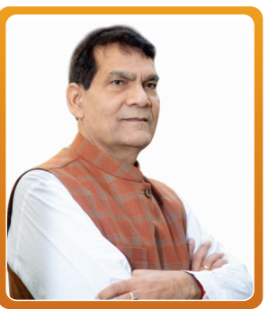
श्री ए० के० शर्मा माननीय नगर विकास मंत्री

निर्धारित तिथि पर शपथ ग्रहण कराते हुए शासन को इसकी सूचना उपलब्ध कराई जाए। शपथ ग्रहण समारोह के बाद आगामी 23 जून तक अनिवार्य रूप से नगर निगम सदन और नगर पालिका परिषद एवं नगर पंचायत बोर्ड की बैठक बुलाने के निर्देश दिए हैं। पहली बैठक में वर्ष 2023-24 में निकायों में कराए जाने वाले कामों की कार्य योजना तैयार करते हुए बोर्ड से अनुमोदन प्राप्त कर शासन को 30 जून तक उपलब्ध कराने के निर्देश दिए गए। शासन स्तर से इसी आधार पर निकायों की कार्ययोजना स्वीकृत की जाएगी।